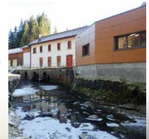
L'ancien bâtiment rénové et le nouveau.