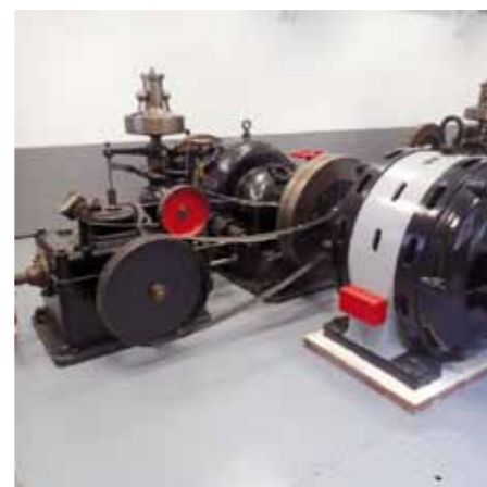
L'ancien régulateur de watts mécanique remplacé aujourd'hui par un système électronique dans le tableau de commande.