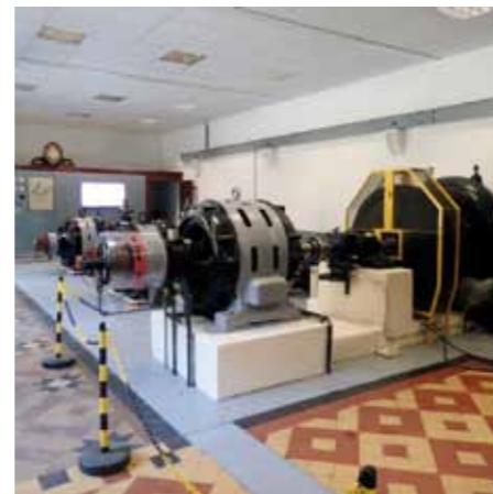
Salle des machines : mémoire historique. Le carrelage d'époque a été conservé autour des nouvelles turbines.