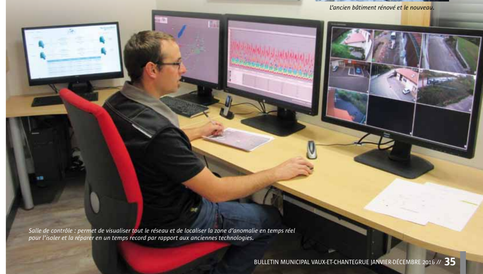
Salle de contrôle : permet de visualiser tout le réseau et de localiser la zone d'anomalie en temps réel pour l'isoler et la réparer en un temps record par rapport aux anciennes technologies.