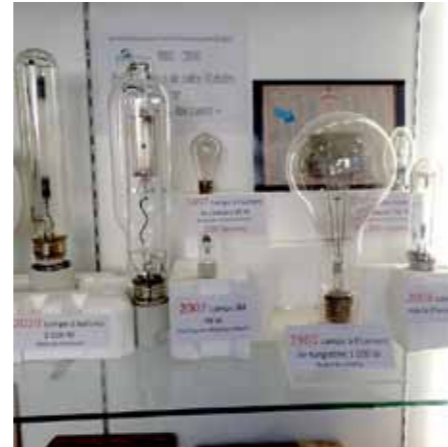
Les ampoules en 1897 : durée de fonctionnement 300 heures - en 2015, une platine de luminaire à LED 80W : durée de fonctionnement 100 000 heures soit 20 années d'éclairage de nuit.

Une conduite libre en ciment de faible pente conduira les eaux du bassin de retenue à la chambre d'équilibre, au-dessus de l'usine. Enfin, une conduite forcée en fonte dirigera l'eau 27 mètres plus bas vers les 3 groupes de turbines et alternateurs développant 120 chevaux chacun.