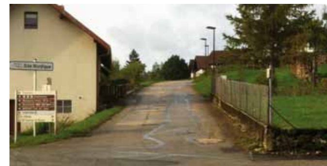
Le choix s'est porté sur des trottoirs au ras de la chaussée pour faciliter l'accès piétons mais aussi et surtout le déneigement.

Sous la conduite du maître d'œuvre CIRESA Benoît INGÉNIERIE, les travaux se sont déroulés durant presque 2 mois.